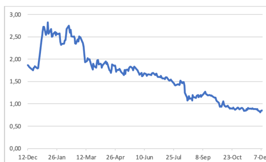
Gráfico de precios (12 meses)