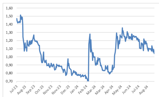
Gráfico de precios (12 meses)